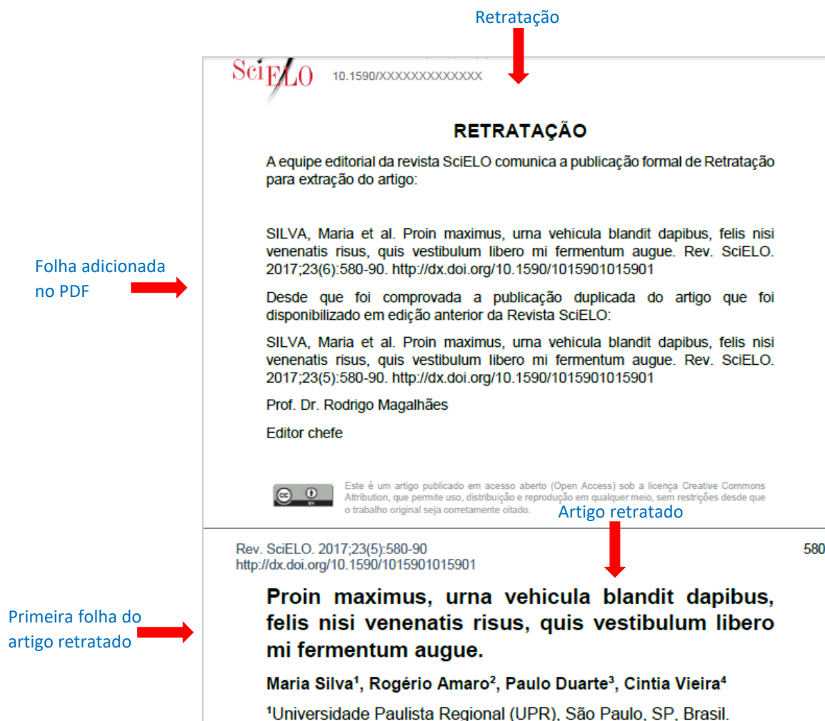
Figura 2 – Adição de folha de retratação no artigo retratado

O PDF do artigo retratado difere para os casos de Retratação Total ou Parcial. A única informação igual, é que deve ser adicionado como primeira folha no PDF do artigo retratado; o PDF da retratação, como demonstra figura 2 .