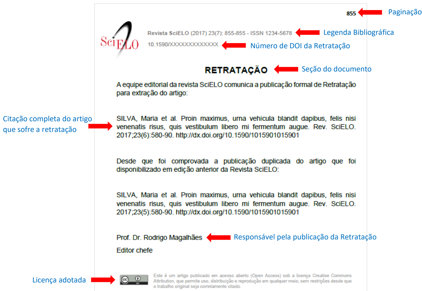
Figura 1 – Modelo de PDF de Retratação