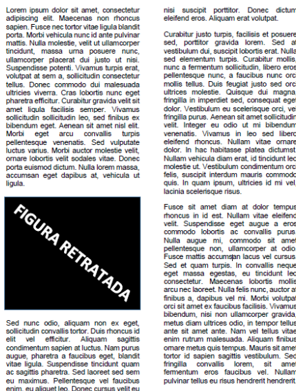
Figura 4 –PDF retratação parcial: exemplo de figura retradata

Nos casos de retratação parcial, onde podem ocorrer problemas com imagens que não foram autorizadas por pacientes, tabelas e gráficos que não foram autorizados pela instituição criadora ou que não permitem distribuição em acesso aberto dentre outros casos que não impossibilitam a permanência da publicação do artigo, deve-se inserir apenas uma mancha preta com o texto Figura Retradata, Tabela Retradata e etc. Exemplo figura 4 :